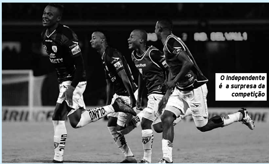
O Independente é a surpresa da competição

Em apenas três oportunidades um clube equatoriano chegou à decisão. Além do título em 2008 da LDU sobre o Fluminense, o Barcelona de Guayaquil foi vice em 1990 e 1998, sendo derrotado por Olímpia e Vasco, respectivamente.