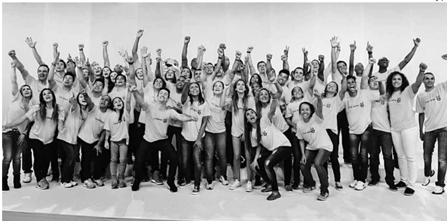
Alguns atletas brasileiros que estarão nos Jogos Olímpicos do Rio de Janeiro comemoraram muito a inscrição do Brasil nos Jogos