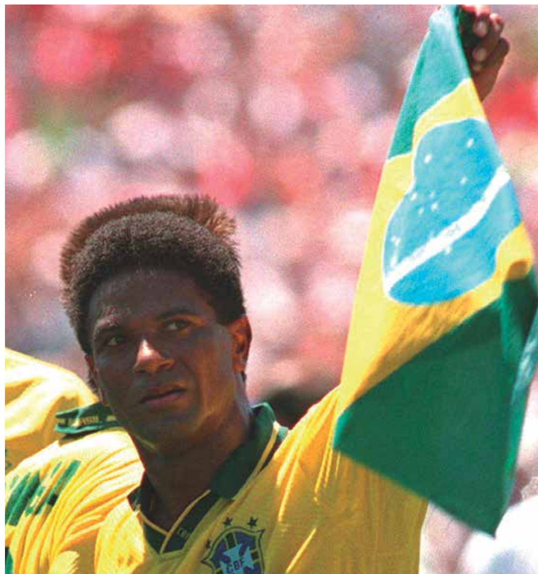
Iomar Nascimento (Mazinho) e Givanildo Vieira (Hulk) foram medalhistas de prata com a Seleção Brasileira de Futebol em 2012.