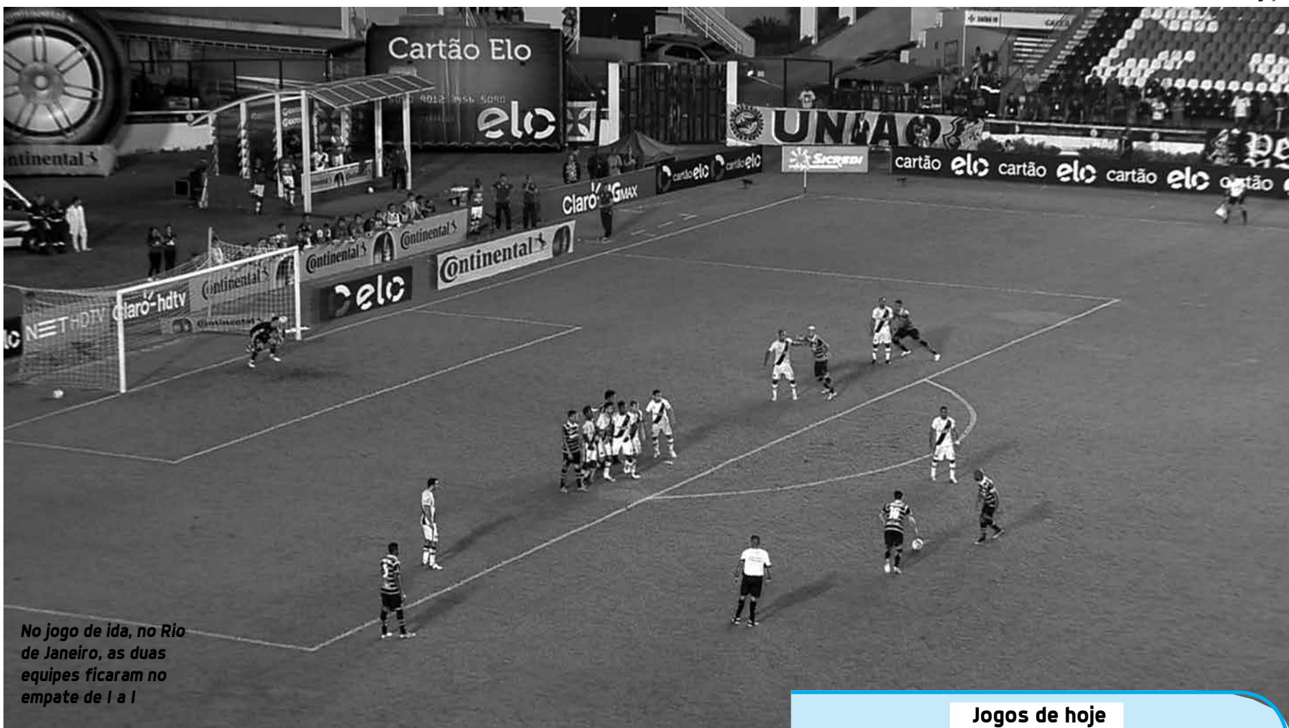
No jogo de ida, no Rio de Janeiro, as duas equipes ficaram no empate de 1 a 1

No próximo sábado, às 18h30, o Santa Cruz tem outro desafio contra um adversário direto na briga contra o rebaixamento. No Estádio do