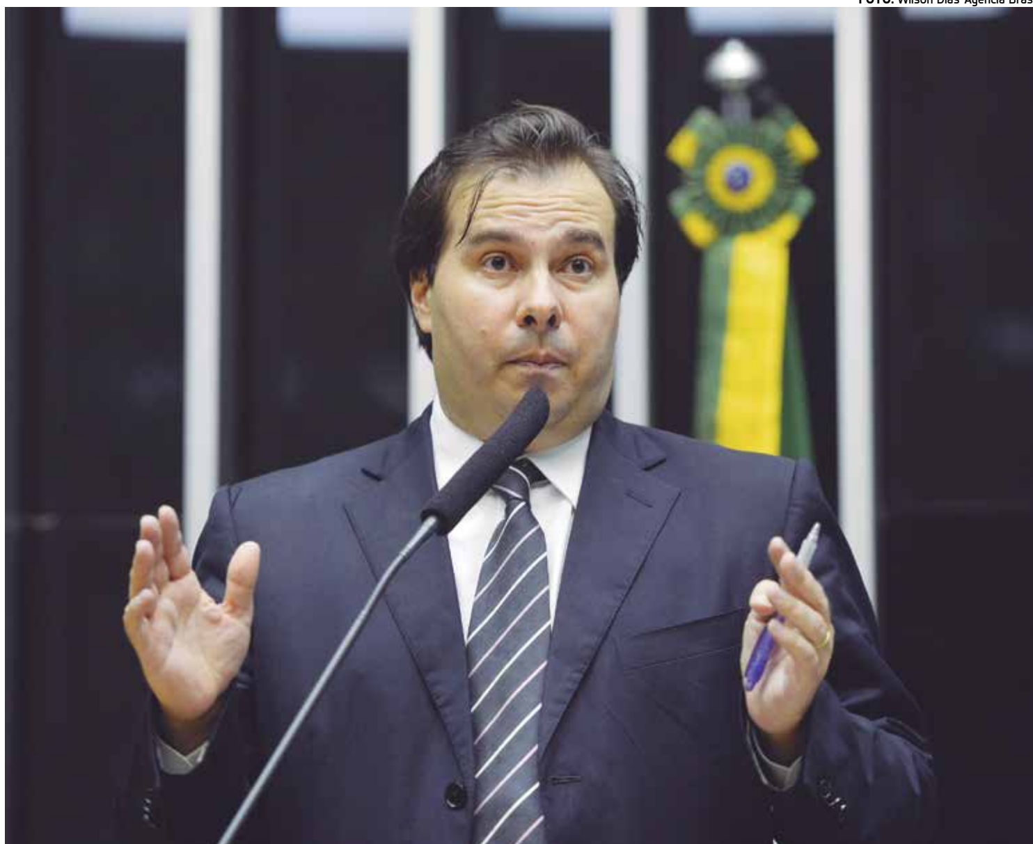
O presidente da Câmara, Rodrigo Maia, discutiu as votações na Casa após o recesso com o líder do governo, André Moura

A dificuldade em se ter um quórum adequado para a votação das propostas se deve ao fato de que, no mesmo período, parte dos deputados participa-