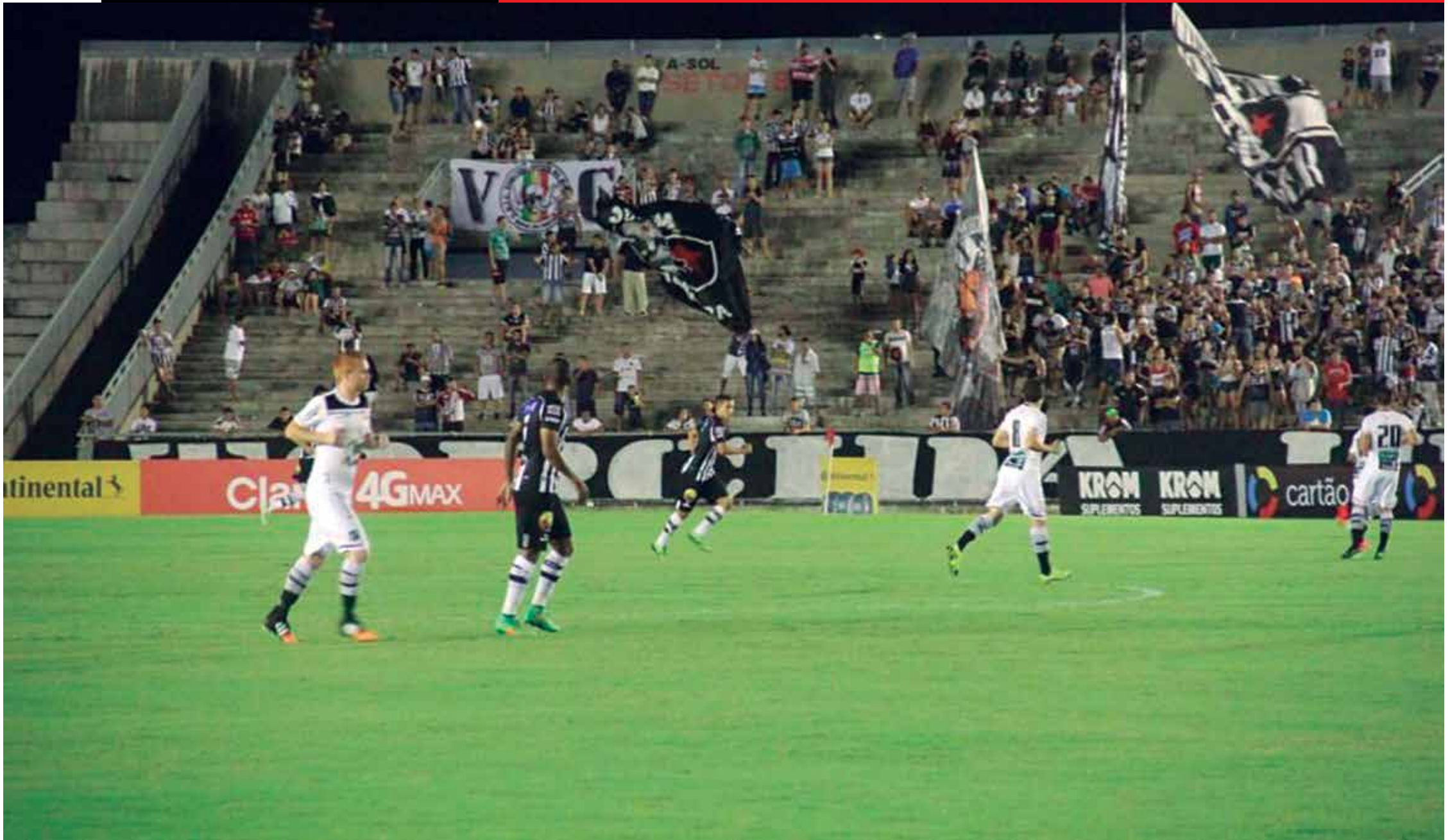
No primeiro jogo, realizado na semana passada no Estádio Almeidão, em João Pessoa, o Botafogo foi soberano em campo, fez o dever de casa e venceu o adversário por 3 a 0, abrindo grande vantagem