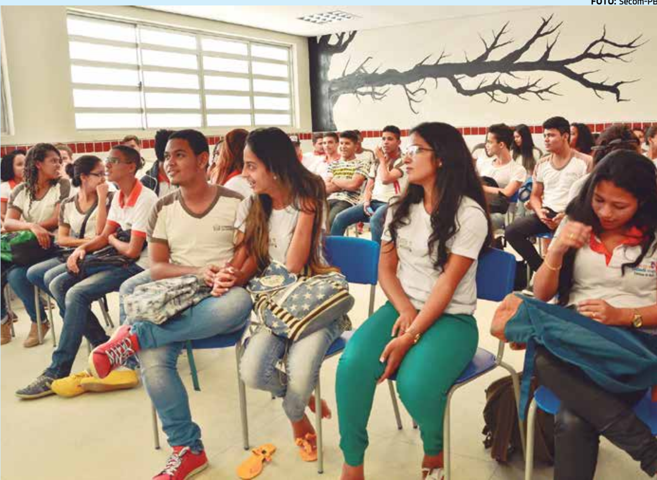
Estudantes lotaram as dependências da escola para debater questões de Ética, Educação e Cidadania no primeiro seminário

dúvida sobre quadrinhos ou fotografia, mas minha paixão pelas fotos é bem maior, por isso decidi participar dessa oficina e fazer com que as pessoas possam refletir sobre o combate à corrupção por meio da imagem parada", explicou.