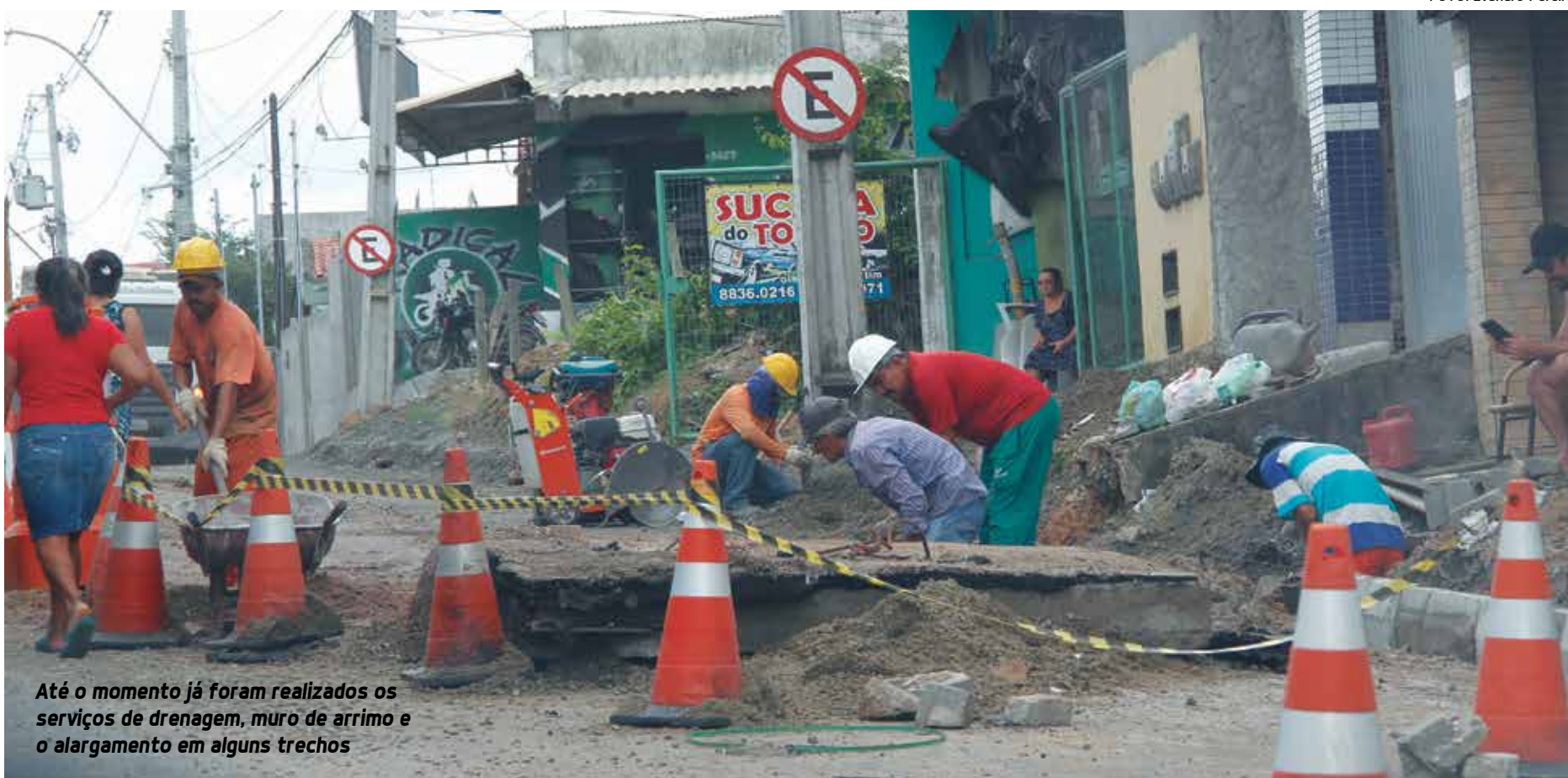
Até o momento já foram realizados os serviços de drenagem, muro de arrimo e o alargamento em alguns trechos

Também faz parte do projeto o remanejamento de serviços públicos, teraplenagem, ampliação do sistema de drenagem, pavimentação e recapeamento em concreto asfáltico, calçadas laterais, sinalização vertical e horizontal e iluminação ornamental.