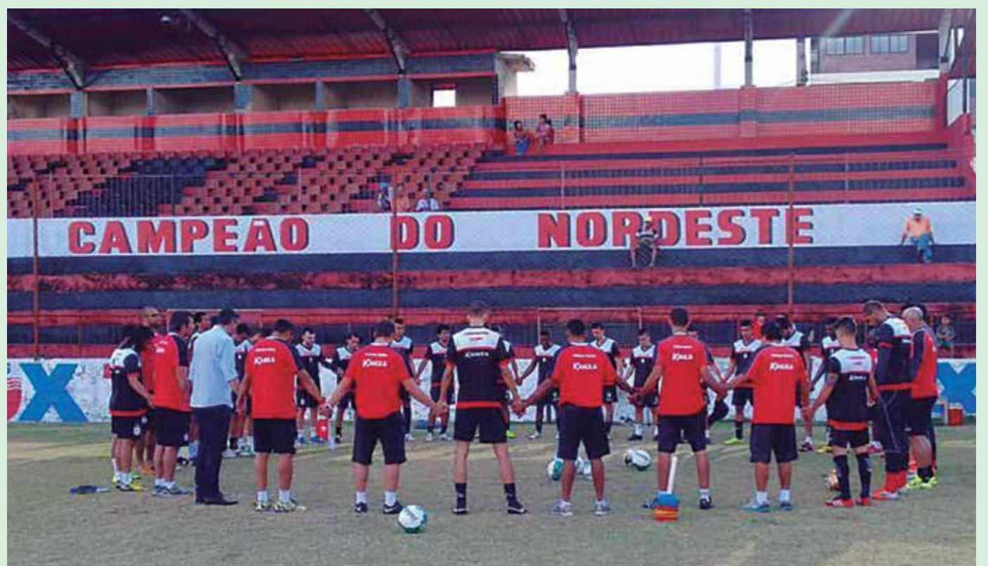
Time está otimista de que o Santa Cruz-PE passará de fase na Copa do Brasil e vaga na Sul-Americana ficará com a Paraíba

A atitude vai de encontro à posição da diretoria do Tricolor, que disse preferir a Copa do Brasil a Copa Sul-Americana. Mas diante da situação do clube no Campeonato Brasileiro, o discurso mudou. "O segundo jogo contra o Vasco vai se refletir, mais ou menos, no que aconteceu com os jogadores que atuaram no primeiro. Talvez, eu encaixe outros jogadores nessa mesma situação. Priorizando sempre o Campeonato Brasileiro. Depois, teremos o Coritiba. Dentro disso, intercalando alguns jogadores, será nossa forma que vamos preparar nossos jogos", disse o treinador da Cobra Coral, em relação ao jogo de hoje, contra o Vasco. (IM)