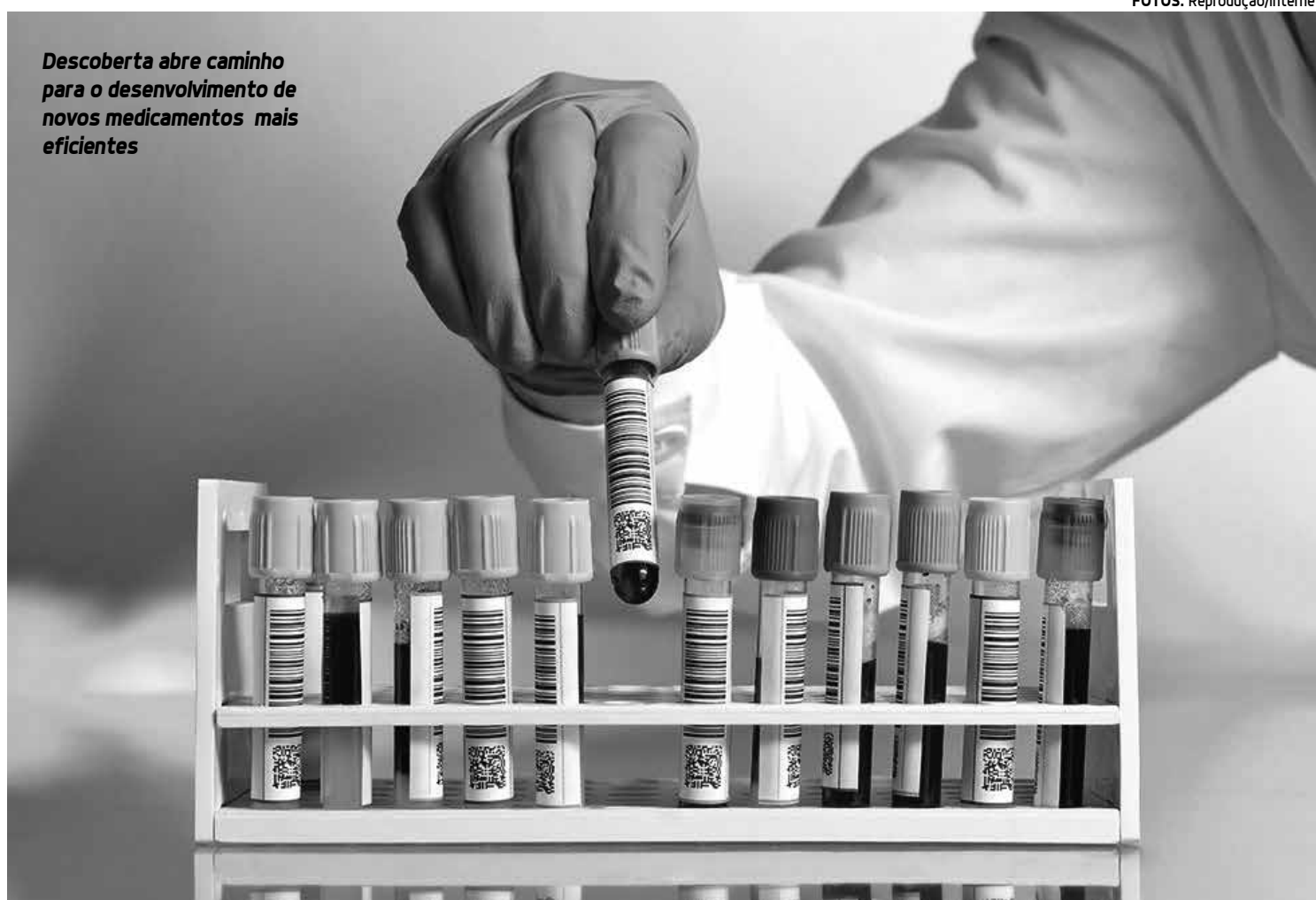
Descoberta abre caminho para o desenvolvimento de novos medicamentos mais eficientes

Segundo os pesquisadores, diversos fatores contribuem para as alterações morfológicas das células do coração, incluindo excesso de neurohormônios, como a noradrenalina e a angiotensina, inflamações e, principalmente, estímulos mecânicos resultantes, por exemplo, da hipertensão. De acordo com o estudo do LNBio, uma enzima conhecida por FAK (Focal Adhesion Kinase, na sigla em inglês), localizada próximo à membrana celular, é ativada por