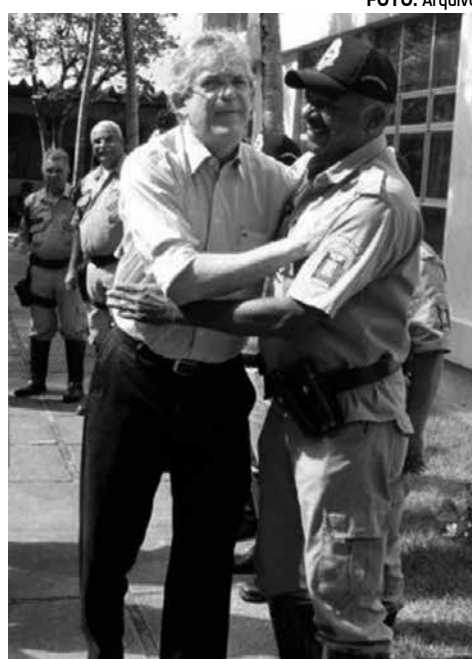
Governador participou das comemorações