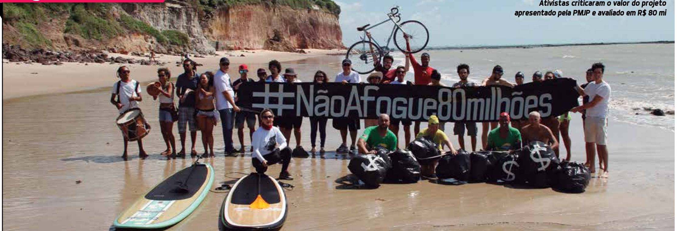
Ativistas criticaram o valor do projeto apresentado pela PMJP e avaliado em R$ 80 mi

Entidades realizaram uma manifestação contra o projeto da Prefeitura da capital para conter a erosão na barreira do Cabo Branco. Eles dizem que a proposta é ineficaz e pedem uma audiência pública para debater o problema. PÁGINA 6